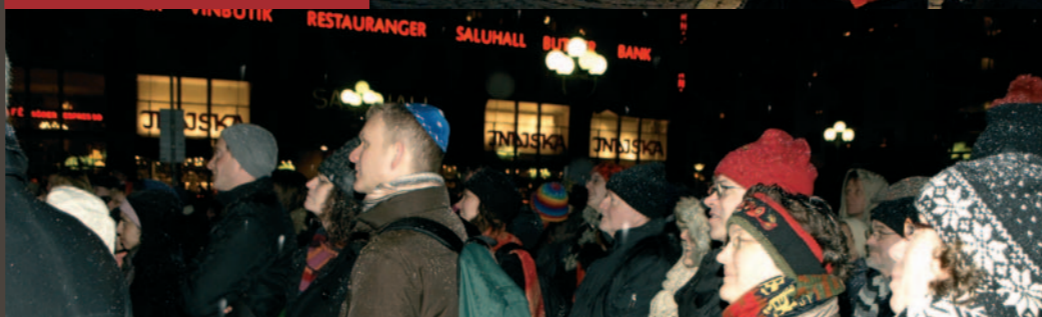
Bön för fred på Medborgarplatsen